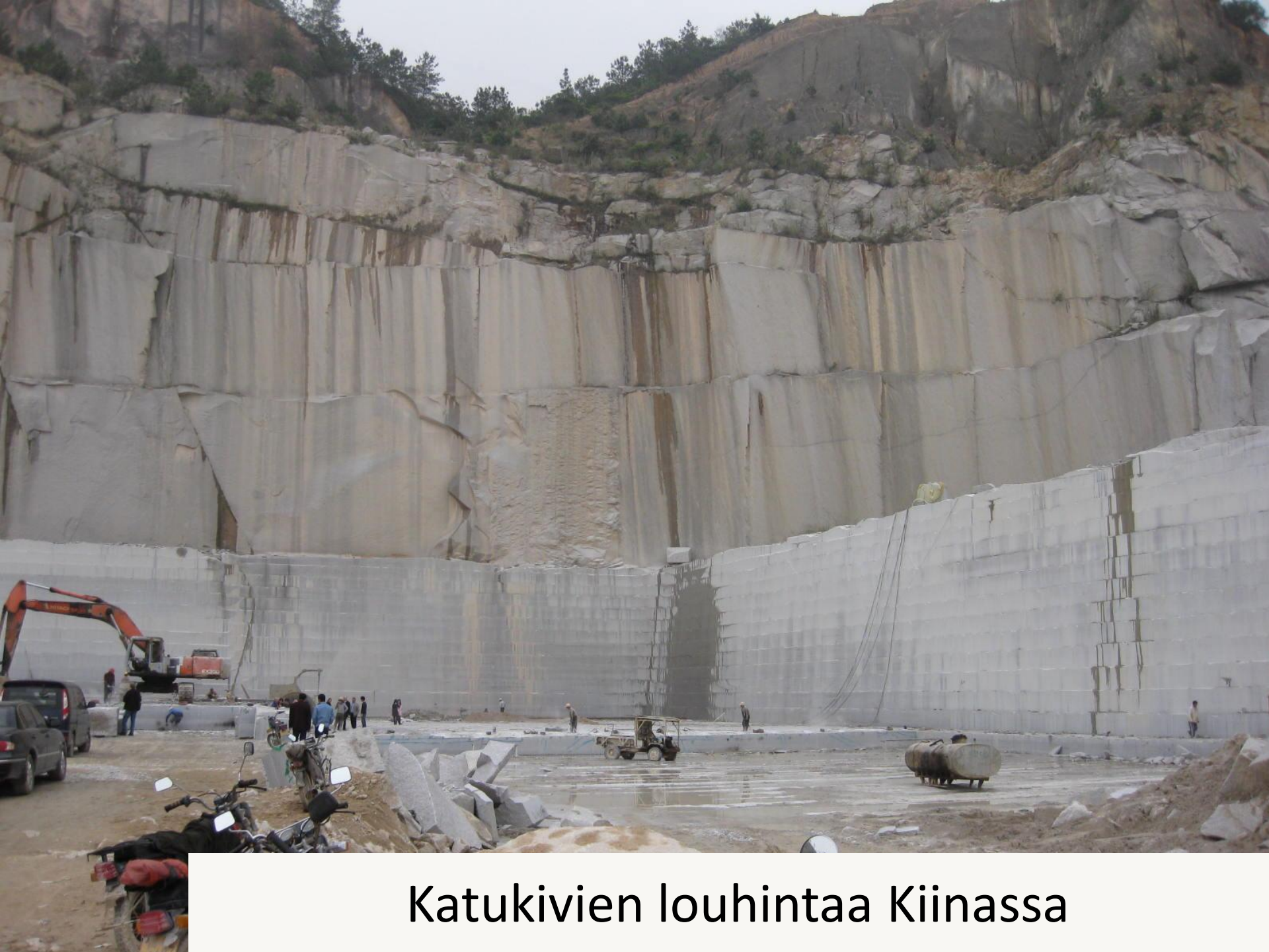
Katukivien louhintaa Kiinassa